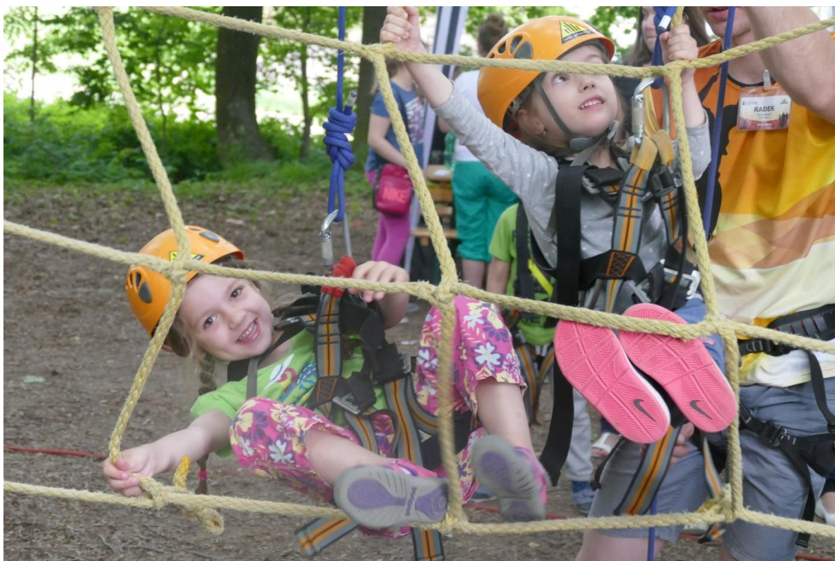
Obr. 4. Dětský den za radnicí – oblíbená lanová dráha