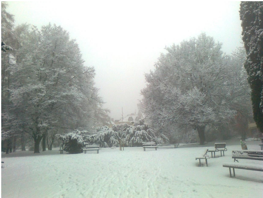
Obr. 1 Sněhová nadílka na Novém náměstí.