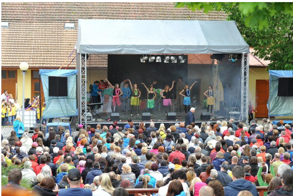
Obr. 9 Školní akademie ZŠ Horácké náměstí