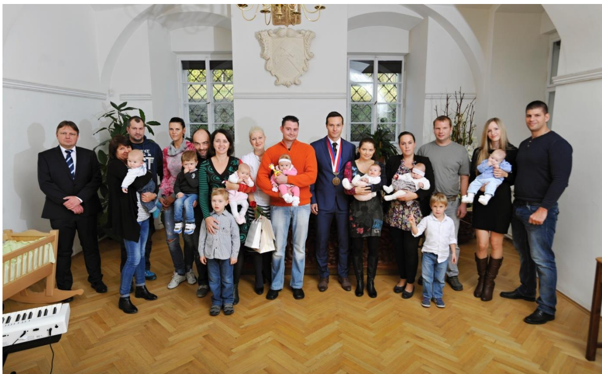
Obr. 3 Jarní vítání občánků