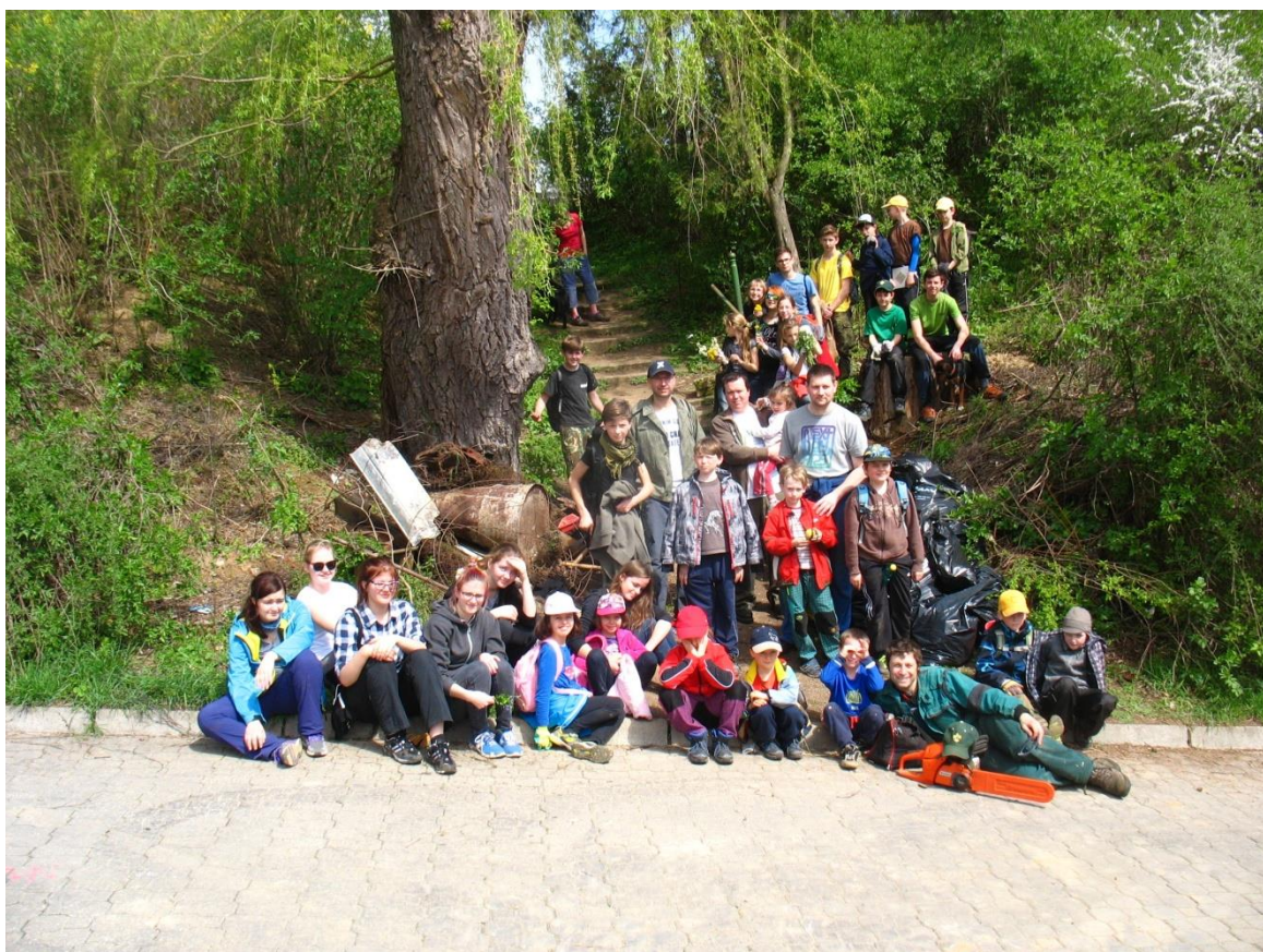
Obr. 10 Vyčerpaní skauti po úklidu býv. cvičiště DTJ na Prumperku