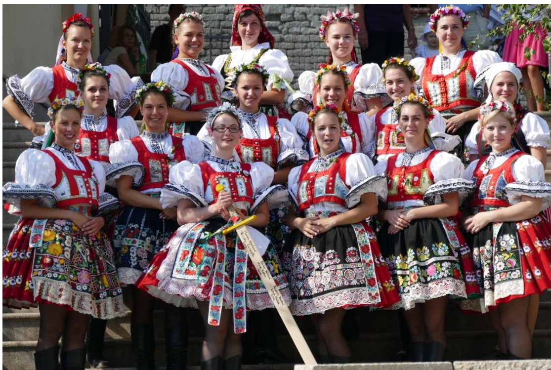
Obr. 17 Půvabné stárky z Řečkovic a Mokré Hory