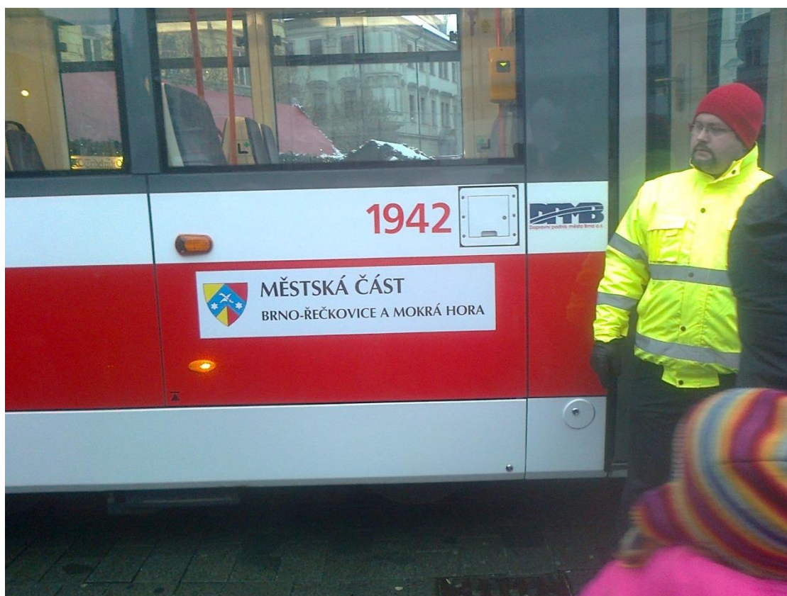
Obr. 7 Tramvaj č. 1942 se znakem MČ Brno-Řečkovice a Mokrá Hora