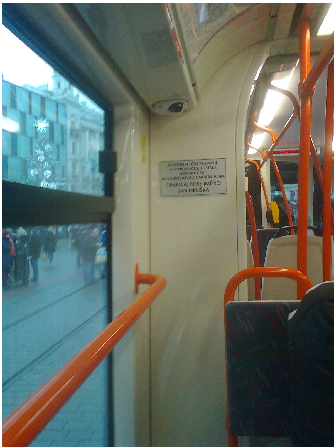
Obr. 8 Dedikační tabulka se jménem Mistra Jana Hrušky