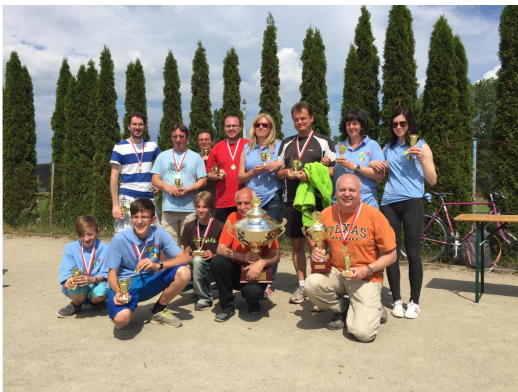
Obr. 16 Naši vítězové v petanque 2016