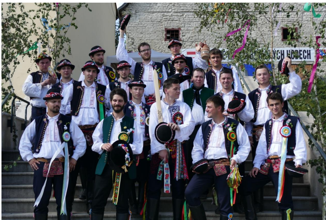
Obr. 18 A naši stárci – to sú chlapi!