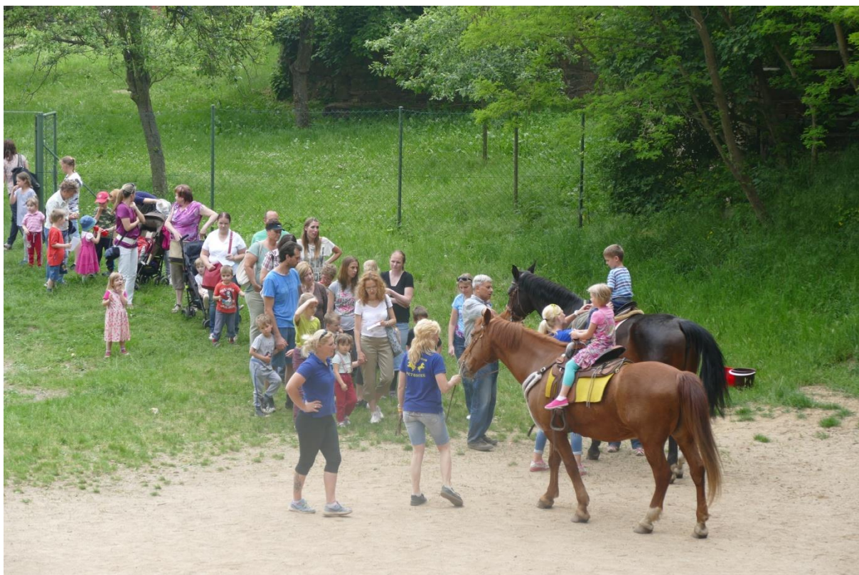
Obr. 5 Dětský den za radnicí - zájem o jízdu na koních