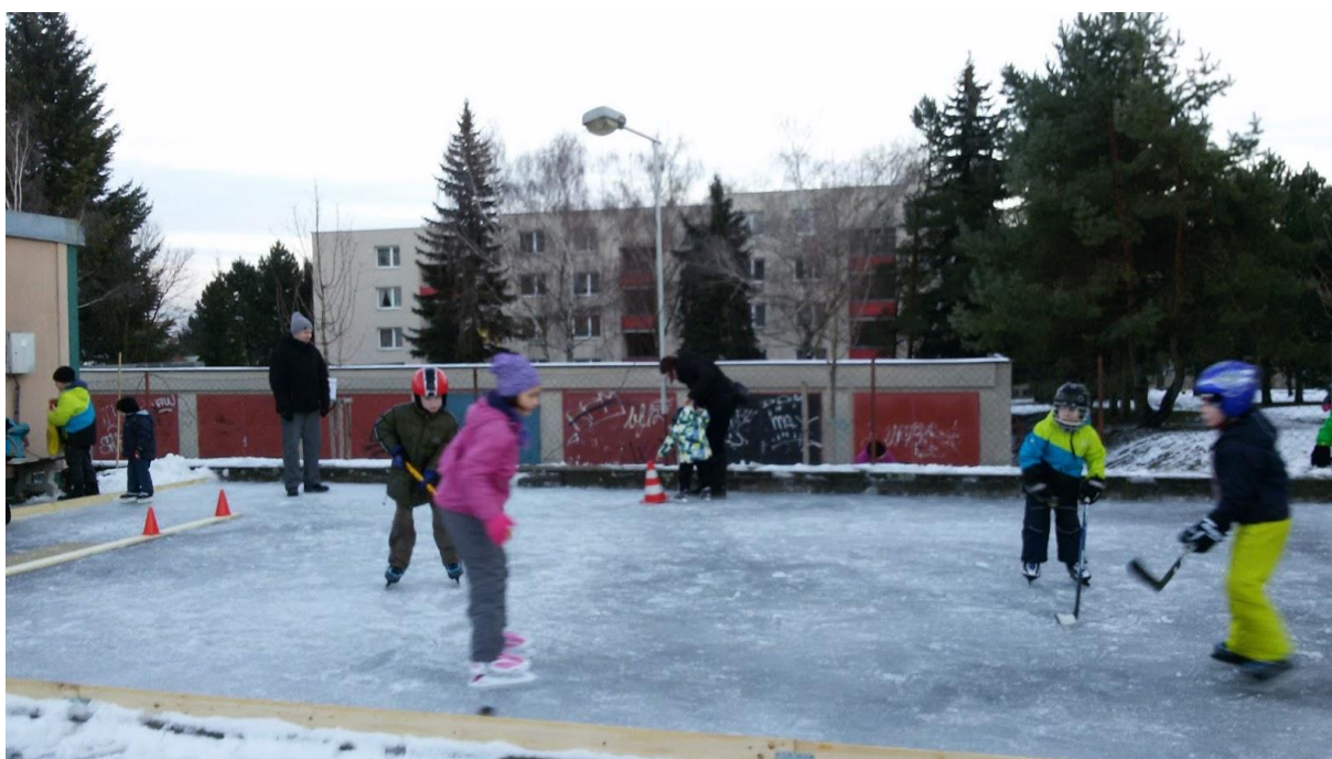
Obr. 12 Kluziště na Orláku