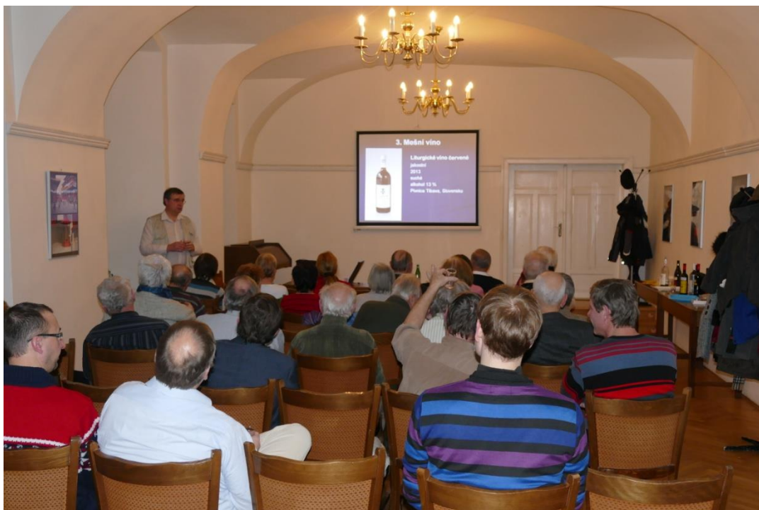
Obr. 2 Beseda o vínech vyrobených „pod dohledem“