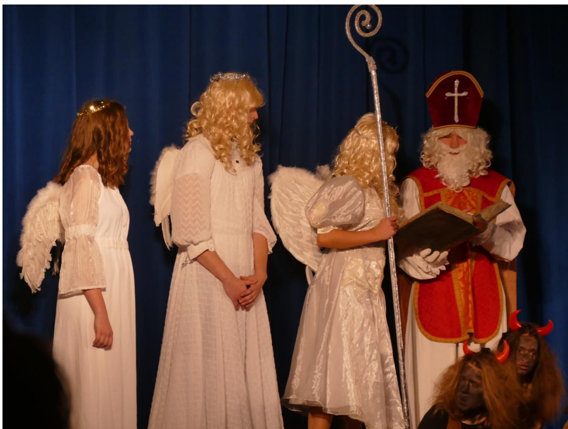
Obr. 20 Mikulášská nadílka